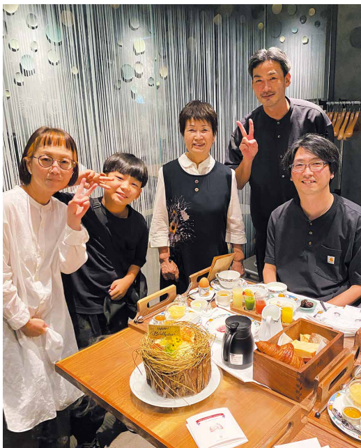
家族との誕生日会。