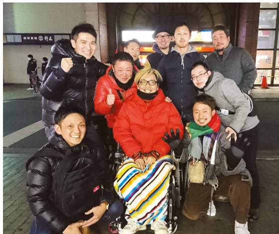
友人たちと忘年会をしたときの一枚。「コロナの影響で、しばらく集まれていないので、また集まりたいですね」。

「水泳選手としては、大阪府下で10番目くらいの成績でした。それで、水泳で大学推薦を取ろうとしたけど、あかんかった。高卒で働こうと思っただんですが、父親に『大学だけは出とけ』と言われまして」。関西大学文学部教育学科の夜間に進学し、昼間は働きつつ、教員を目指して大学に通った。教育実習も終えて、順調に教師への道を進んでいた最中、授業のあり方を巡って大学の担当教授と衝突する。「まあ、若気の至りですわ」。教員免許を取得するために必要だった単位を自ら放棄して、卒業後